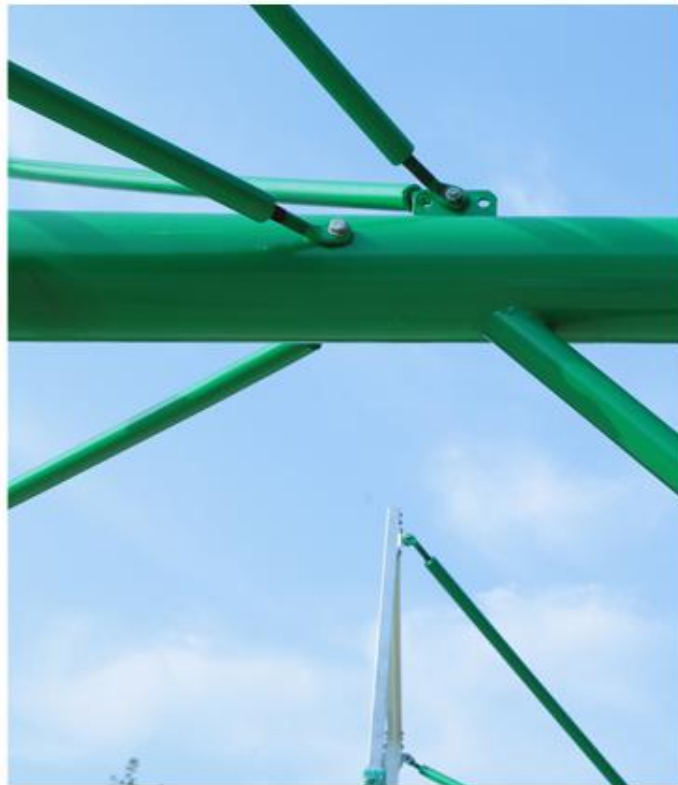
第三步：安装拉杆 长杆在上 短杆在下