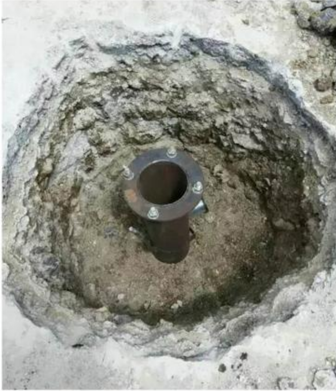
第一步：安装预埋件