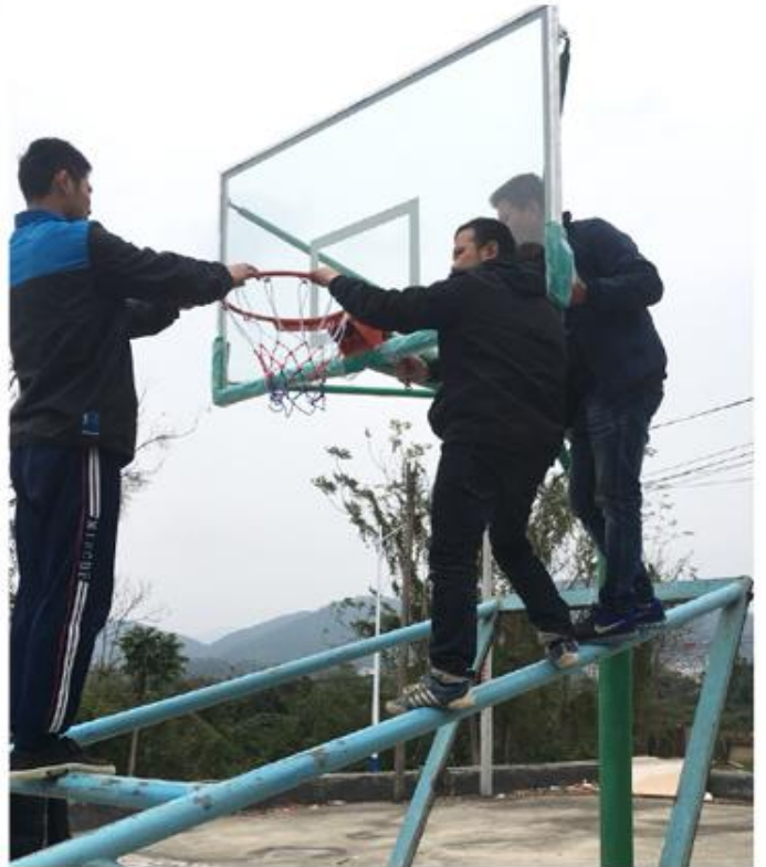
第四步：安装篮板 调整篮板 篮筐的位置，拧紧螺丝固定