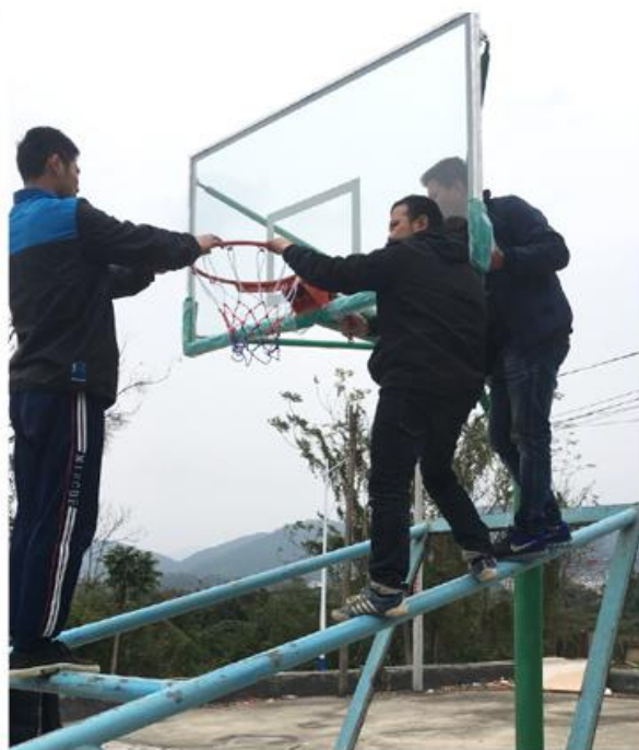
第四步：安装篮板 调整篮板 篮筐的位置，拧紧螺丝固定